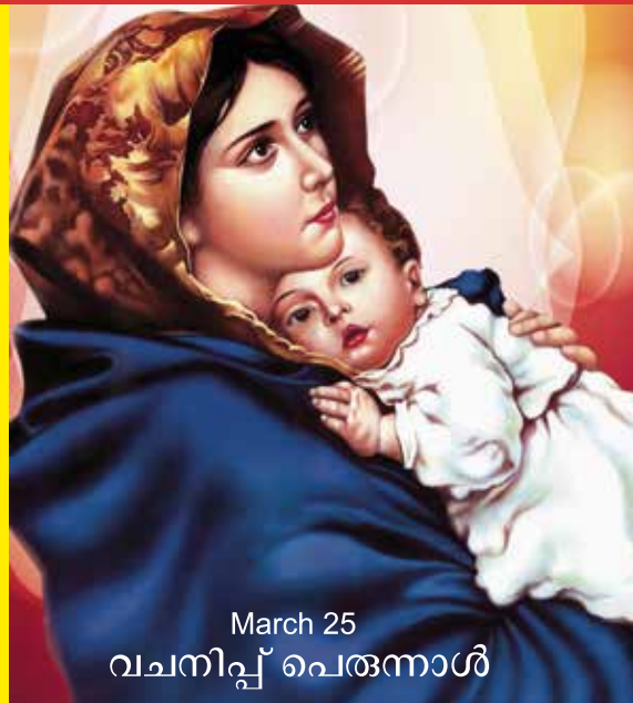
March 25 വചനിപ്പ് പെരുന്നാൾ